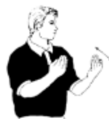
18. Tillåtelse att beträda spelplanen vid time-out

När bollen har passerat sidlinjen får det lag som ej rörde bollen sist inkast. Den som lägger inkastet skall stå med en fot på linjen.