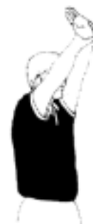
11b. Passivt spel

Att hålla bollen inom det egna laget utan att någon anfallshandling är synbar eller inget försök görs att komma till målskott. Domarna bör markera genom ett varningstecken. Om laget trots detta inte försöker nå ett avslut mot mål (inom 5 sekunder) skall det försvarande laget erhålla ett frikast.