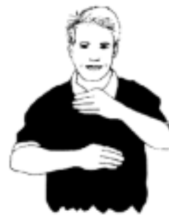
3. För många steg. Bollen hålls mer än 3 sekunder

- En utspelare får ej passa in bollen till egen målvakt som befinner sig i målgården (frikast).